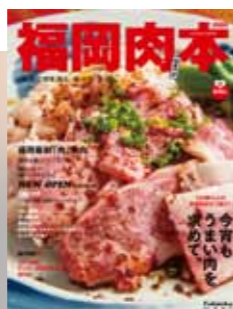
2016年 第3弾 肉本表紙