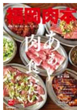
2018年 第5弾 肉本表紙

媒体名 / 福岡肉本 2019 発行日 / 2019年7月31日(水) 装丁 / A4(297mm×210mm)、112ページ(予定) 部数 / 50,000部 価格 / 640円+税 期間 / 1年間 販売 / 福岡県下の書店・コンビニエンスストア