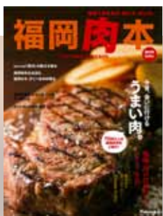
2014年 第1弾 肉本表紙