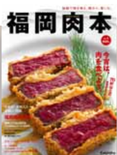
2015年 第2弾 肉本表紙