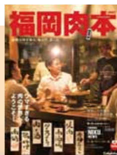
2017年 第4弾 肉本表紙