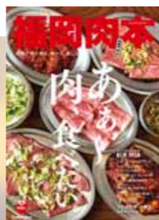
2018年 第5弾 肉本表紙

2019年も肉のニュースは話題の中心に! 「福岡肉本」は、おかげさまで5号目を迎えることができました。今年は例年以上の肉情報を盛り込みつつ、より読者の目線に立ち、「これ一冊あれば肉情報はOK!」、実際に「使える肉本!」を目指して、一人でも多くの肉LOVERを虜にできる一冊に仕上げていきます。